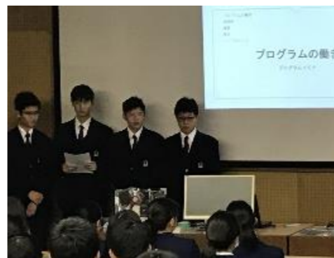
↑高校生とともにプログラミング