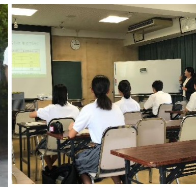
英検準2級は高校生と対策講座↑