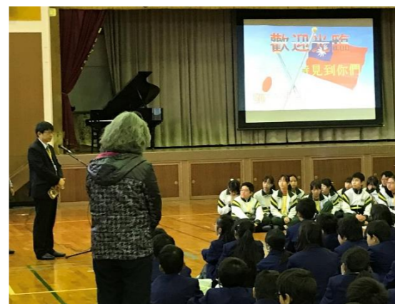
↑昨年12月に台湾大有国民中学校の訪問を受けました。事前にテレビ電話で交流しました↑

昨年はベトナム・カンボジア・台湾の学校と交流を持ちました。郡英語暗唱大会をはじめ様々な大会に出場しています。英語検定は3級取得を目標にしています。